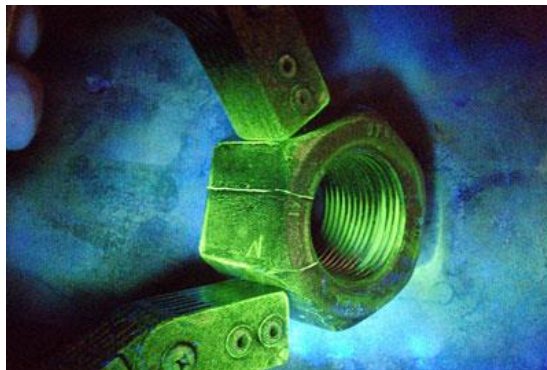
Slika 25 Magnetska kontrola [24]

Ispitivanje magnetnim česticama koristi se za otkrivanje površinskih i podpovršinskih grešaka kod feromagnetičnih materijala na principu magnetske indukcije. Najpreciznije rezultate dobivamo na površini objekta, udaljavanjem od površine naglo pada mogućnost pronalaska greške. Oko vodiča kroz koji prolazi električna struja stvara se magnetsko polje, čije silnice po pravilu desne ruke prolaze ispitivani feromagnetični materijal.