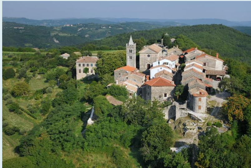
HUM – najmanji grad na Svijetu