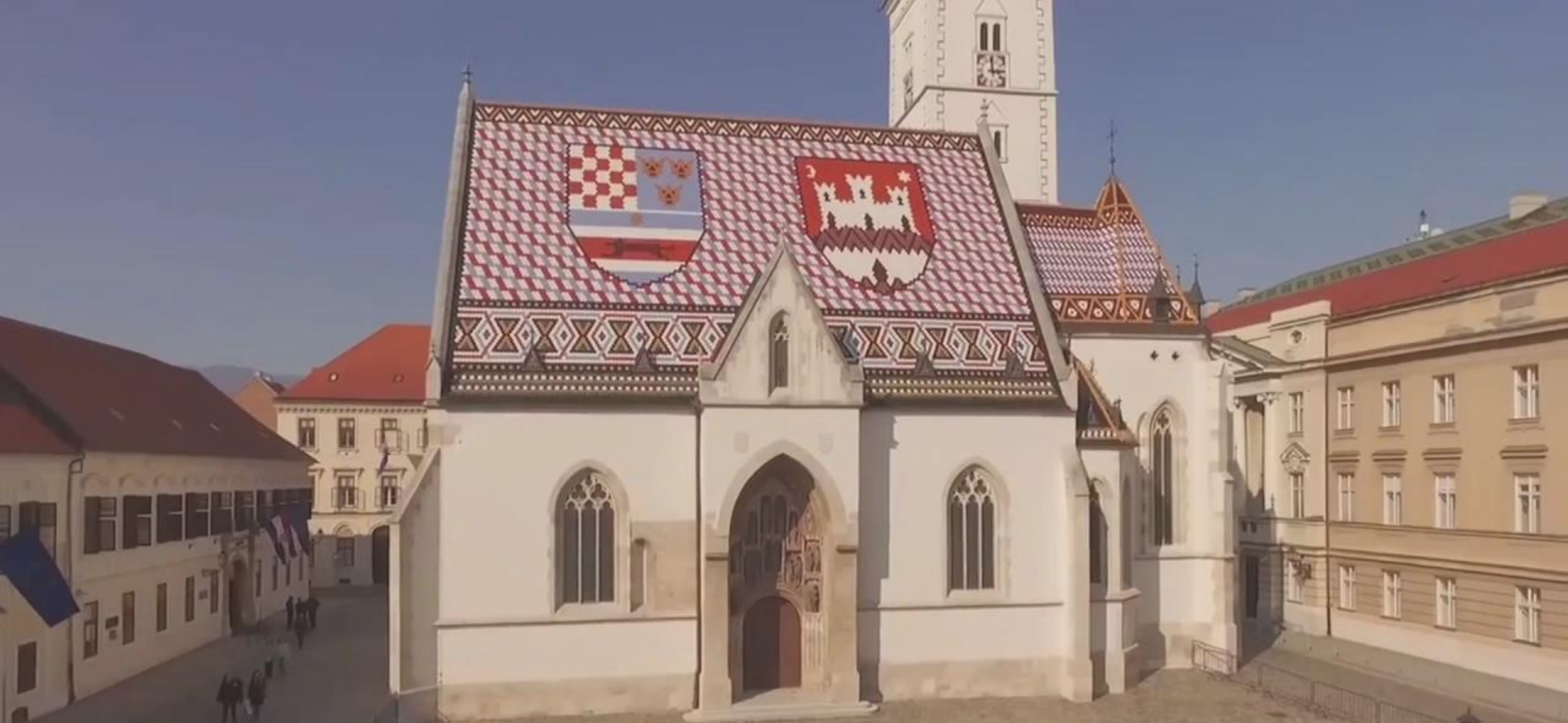
Gradska naselja u Hrvatskoj