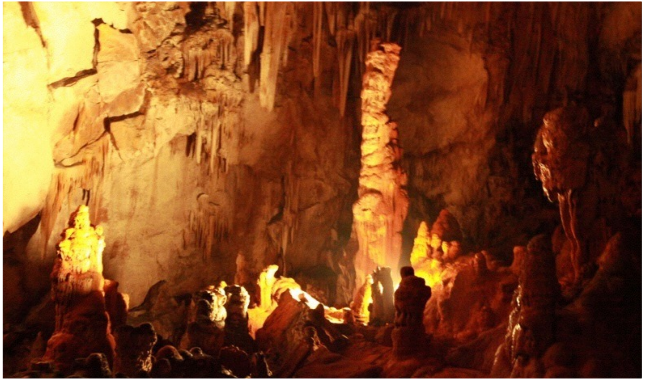
PLATON, MIT O PEĆINI