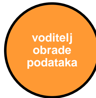
voditelj obrade podataka

označava fizičku ili pravnu osobu, tijelo javne vlasti, agenciju ili drugo tijelo koje prikuplja i obrađuje osobne podatke te je odgovoran za njih