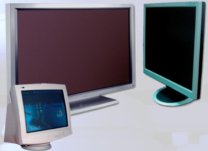
CRT, plazma i LCD monitor