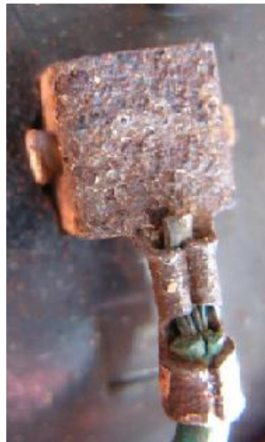
Sl.6. Pojava kontaktne korozije na spojnom dijelu [15].

Ako se u agresivnom mediju (elektrolitu) nalaze u dodiru dva metala različitih potencijala, doći će do stvaranja galvanskog članka, pri čemu će više korodirati onaj element koji se ponaša kao anoda tj. koji je u tom članku neplemenitiji. Kontaktna korozija uzrokovana je razlikom elektropotencijala dva metala, a njena brzina ovisi o vrsti materijala i vodljivosti medija. Tako npr. u normalnim uvjetima vlažne atmosfere u spoju bakra ili nikla i čelika, korodirati će čelik, a u spoju s cinkom korodirati će cink. A u oksidirajućoj otopini koja djeluje pasivirajuće, u spoju korozijski postojanog čelika i bakra korodirati će bakar [1].