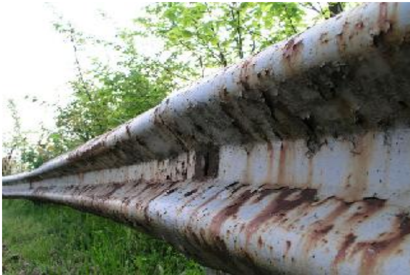
Sl.1. Pojava opće korozije – nelegirani konstrukcijski čelik - zaštitna ograda [15]

Opća korozija je najrašireniji i najčešći pojavni oblik korozije, ali i tehnički najčešće najmanje opasan, a nastupa tako da zahvaća cijelu površinu materijala, pri čemu je intenzivnost oštećenja svugdje jednaka ili pak lokalno različita, slika 1. Opću koroziju nelegiranih čelika uobičajeno nazivamo "hrđanje". Intenzivnost opće korozije mjeri se gubitkom dimenzija u mm/godini ili gubitkom mase \text{g/m}^2\text{h} [1].