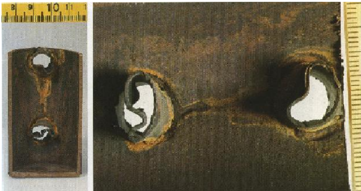
Sl.7. Kontaktna galvanska korozija – galvanska korozija u cijevi sa deformacijom kod nelegiranog čelika [16].