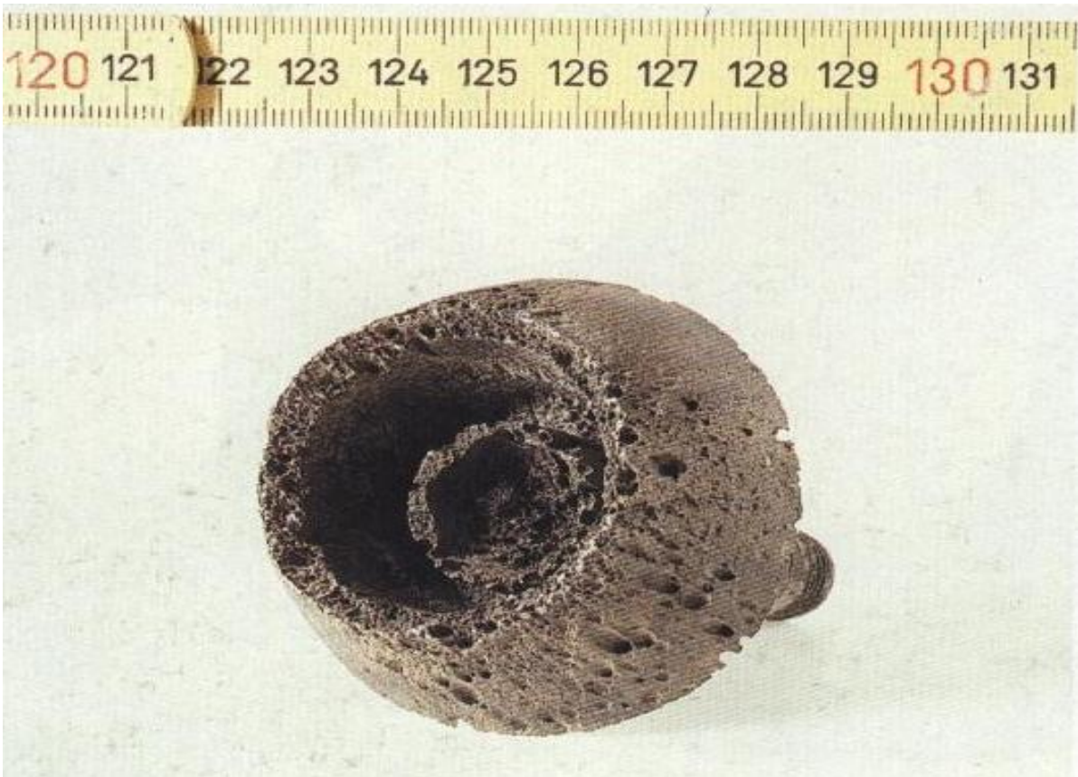
Sl.4. Rupičasta korozija – ozbiljan rupičasti napad po cijeloj površini dijela od legiranog čelika [16].