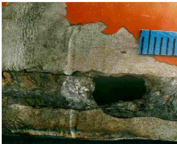
Sl.3. Selektivna korozija – pripoj zavarenog spoja od Cr-Ni čelika s neprimjereno visokim udjelom delta ferita na zavaru [15].